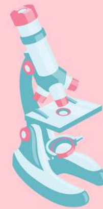
biopsie, analiză citologică