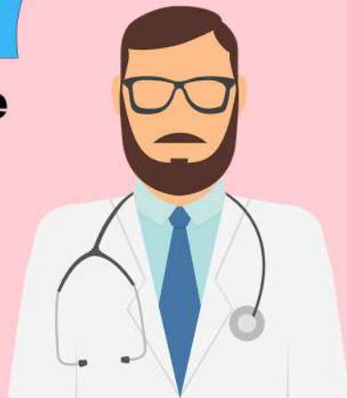
consultație cu un senolog